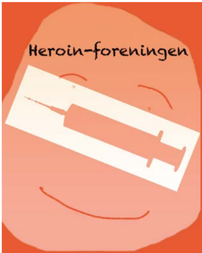
Vittighed og tekst: Nils Holmquist