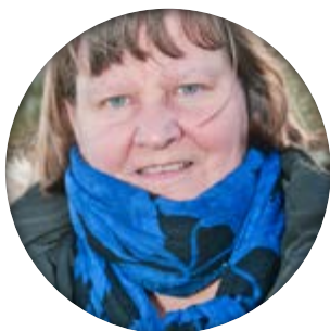
Tekst og foto: Tina Hesselbjerg

L ige nu sidder jeg i en Flixbus på vej hjem igen fra Århus med retning mod København. Har pt. to sæder, som jeg kan have mig selv og alle mine pakkelliker på. Tænk hvis nu man fik brug for et kamera og ligeså en pc. Jeg sidder og kører baglæns, ved et bord, og har dermed alle mine medpassagerer foran mig, Face to face.