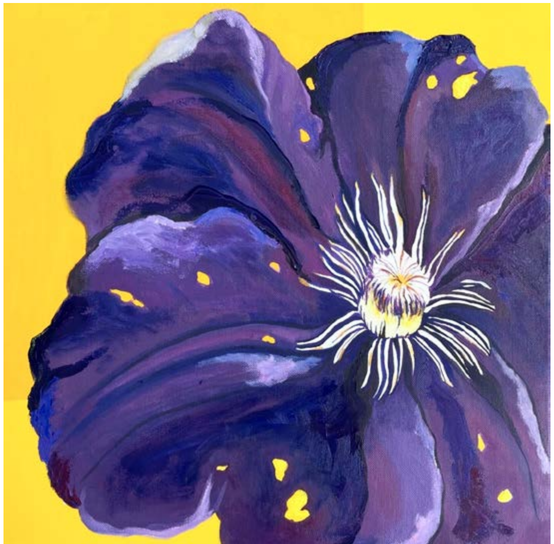
Maleri: Lene Astrup

Foreningen af danske heroin-misbrugere har lagt sag an mod brødbranchen og dansk bagerlaug. Misbrugerne påpeger at man er gået et nålestik for langt i stigmatiseringen af junkier. Det er produktet kammerjunkere, der får dem til at føle sig udsat. Når man kan blive sammenlignet med en kammerjunker, henviser det til at man er passiv modtager af et så sløvende stof, at man ligger på et kammer. Andre kan endda tro at man har sovekammerøjne. Heroin-misbrugerne siger, at de ikke vil grupperes med nogen, der ligger på deres flade i et kammer. De er skam på hårdt arbejde hver dag, lyder det fra foreningen.