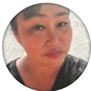
Tekst og foto: Lene Kristiansen Deltager på Sommerlejren

D et er efterhånden blevet en tradition, at lapperne mødes på den skønne og mangfoldige Brenderup Højskole ved Middelfart. En arbejdsgruppe har i løbet af året planlagt, hvad opholdet skal indeholde. I år havde LAP fået en bevilling fra TrygFonden til at gennemføre ugen, og det er vi meget taknemmelige for.