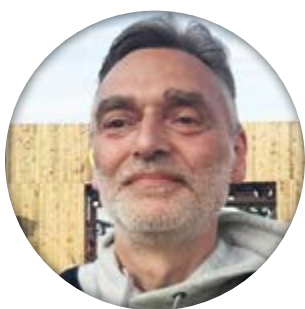
Tekst og foto: Tom Jul Pedersen

I drætsfestival for sindslidende foregår i Vejle, oftest i juni måned. Men inden for de sidste par år har den taget navneforandring til ”Idrætsfestival for sindet”.